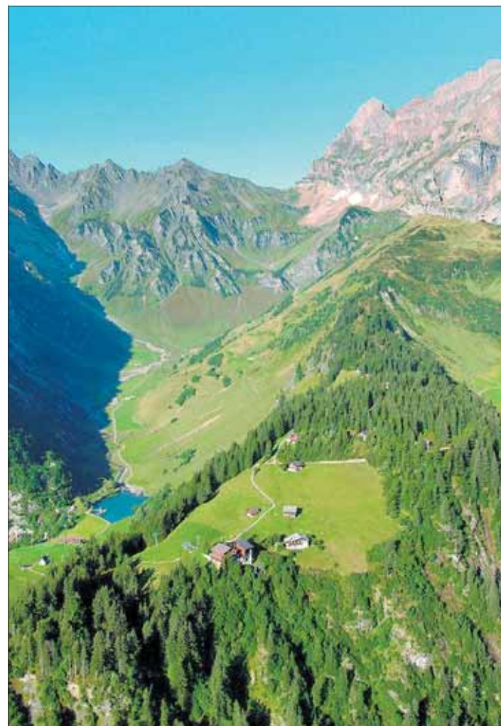
Bergstation Brüsti mit dem kleinen, romantischen Waldnachersee.

* Der Freizeitbon gilt für den Erwachsenentarif.